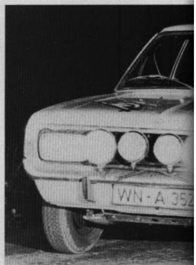
1 Überraschungssieger Röhl/Marecek in vollem Drift